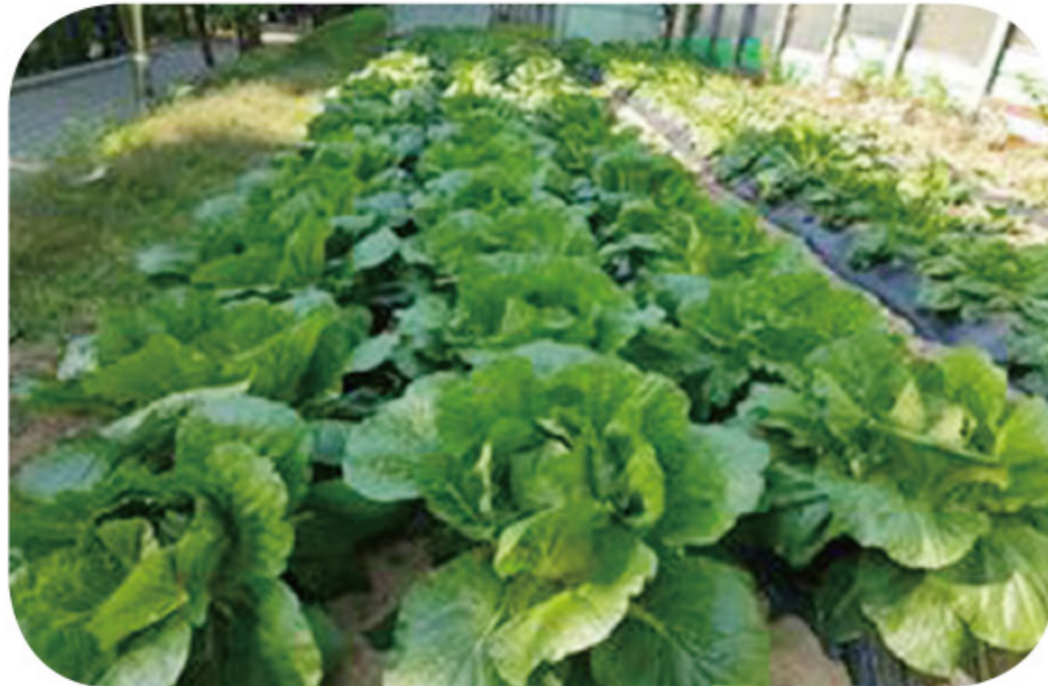
▲ 텃밭에서 잘 자라고 있는 배추

첫째, 학생들이 인내심을 갖고 기다리는 마음을 갖게 되었다는 점이다. 텃밭에 재배하는 농작물은 특별한 기술이 없어도 재배할 수 있는 상추, 배추, 무, 오이 등이다. 농작물은 아무리 과학 기술이 발달했어도 속성 재배에 한계가 있다. 파종해서 성장하고 수확하는데 어느 정도 시간이 필요하다. 비교적 짧은 시간에 수확할 수 있는 상추라 하더라도 파종에서 수확까지 거의 2개월이 소요된다. 이 기간 동안 매일 물도 주고 잡초도 제거하고 살펴보는 일은 여간한 인내심이 아니면 안 된다.