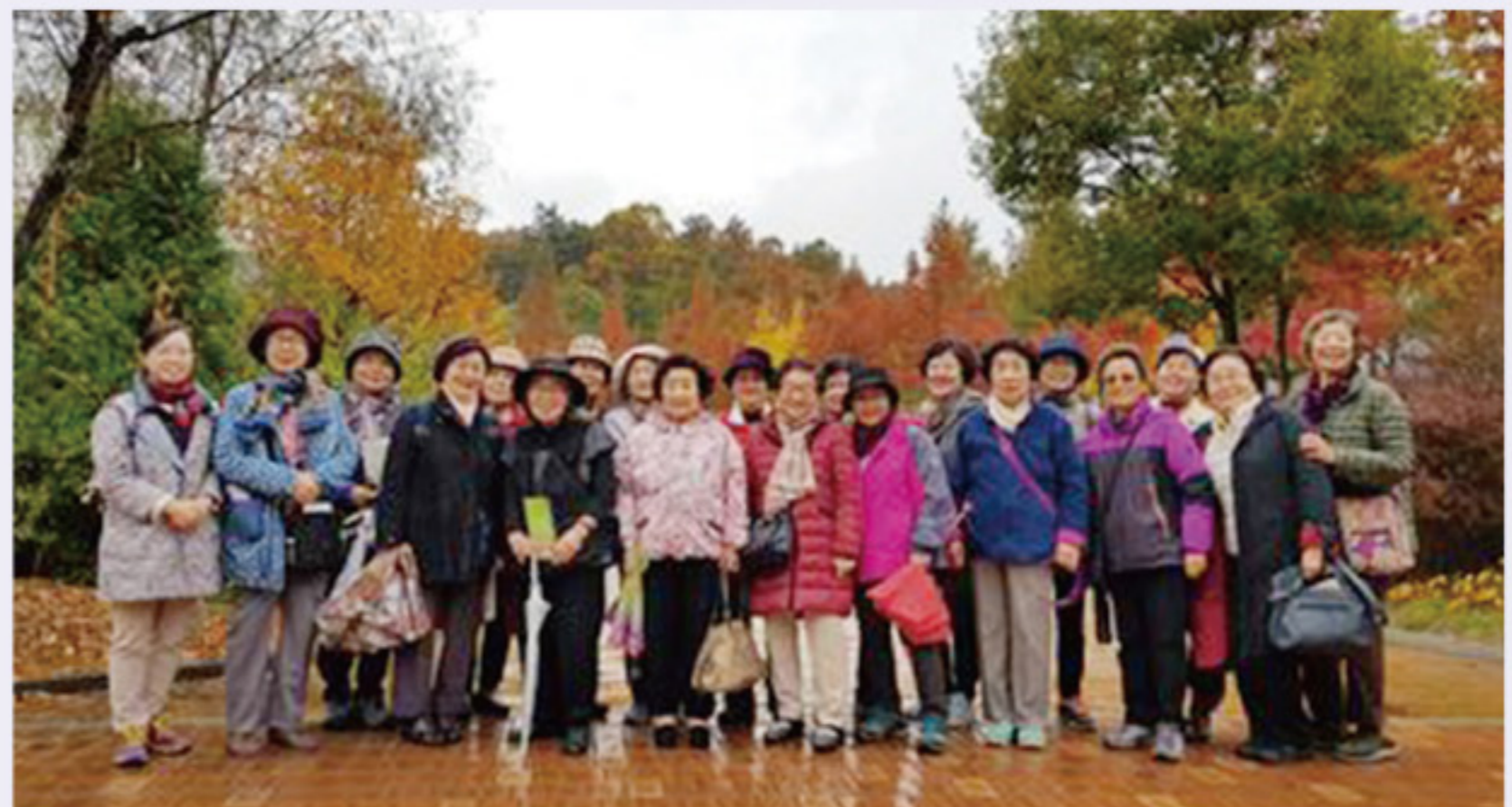
▲ 황학산 수목원에서

오전 9시 30분 종합운동장역을 출발하여 10시 40분 명성황후 생가에 도착했다. 문화해설사의 자세한 설명을 들으며 명성황후 기념관을 관람하고 이어서 생가를 방문하였다. 해설사의 해설을 통해 그 동안 우리가 명성황후에 대해 잘못 알고 있던 사실들을 많이 깨닫게 된 유익한 시간이었다. 두부전골과 콩비지전으로 점심식사를 한 후 황학산 수목원을 탐방하였는데 비가 와서 우산을 쓰고 탐방을 하여 선배님들께서 불편하실까 신경을 썼으나 선배님들께서는 비가 와서 공기가 맑아 사진이 아주 깨끗하고 선명하게 잘 나온다고 오히려 날을 선택을 잘했다고 말씀 해주셔서 감사했다.