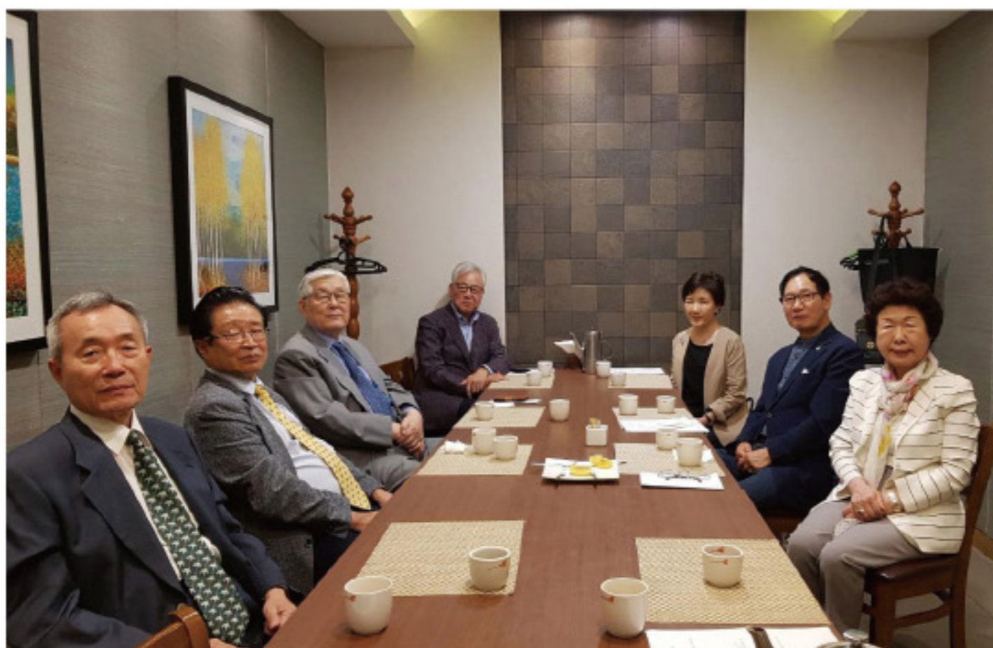
▲ 지난 9월 14일 상임고문 및 학장 회의

※ 원만한 행사준비를 위하여 '참석여부'를 11월 16일까지 알려주시면 감사 하겠습니다. 사무국에서도 불편함 없이 모실 수 있도록 최선을 다해 준비하겠습니다.