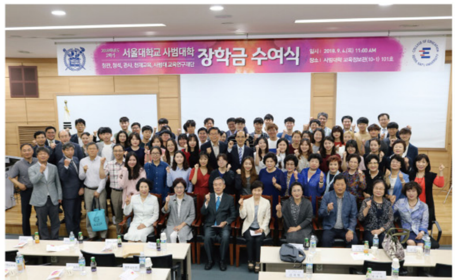
▲ 지난 9월 3일 장학금 수여식 기념 촬영